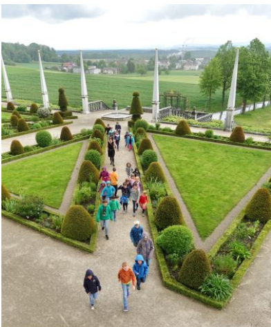
Schatzsuche auf Schloss Waldegg in Feldbrunnen-St. Niklaus