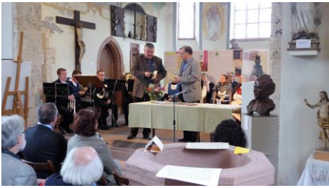
Jubiläumsfest im Heimatmuseum Schwarzbubenland Dornach