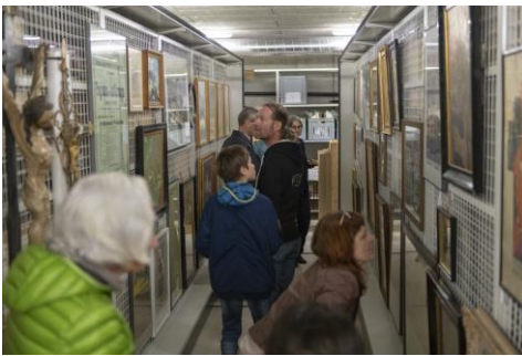
Depotführung in Olten